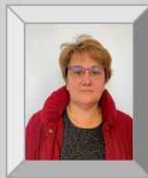
Sandrine Delaunay Cabin Interior et Sièges Pilotes