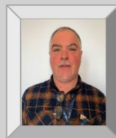
Yvan Fornel Aérostructure CH4